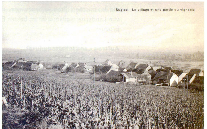
Sugiez Le village et une partie du vignoble