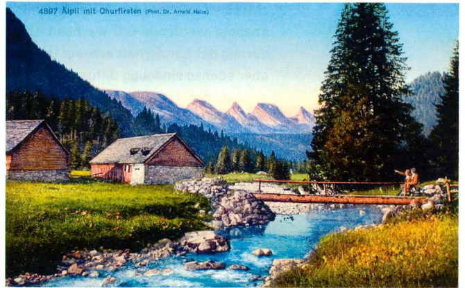
4897 Äpli mit Churfürsten (Phot. Dr. Arnold Heini)