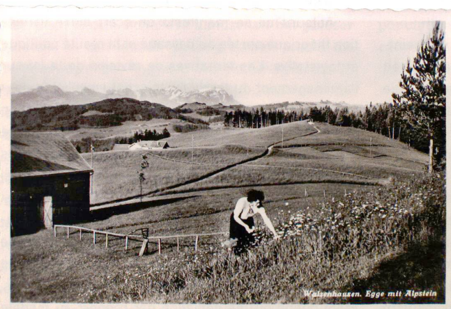
Walenhausen. Egge mit Alpstein