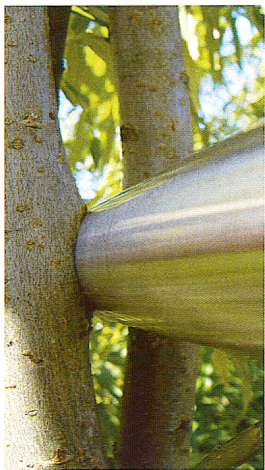
1 Buerau Baubotanik (4)