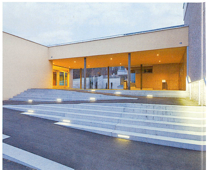
Zeljko Gataric Fotografie