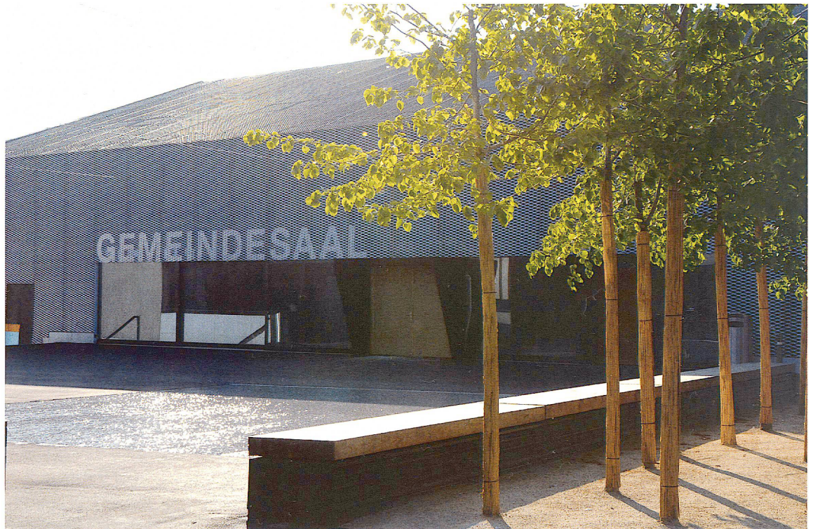
raderschall ag landschaftsarchitekten