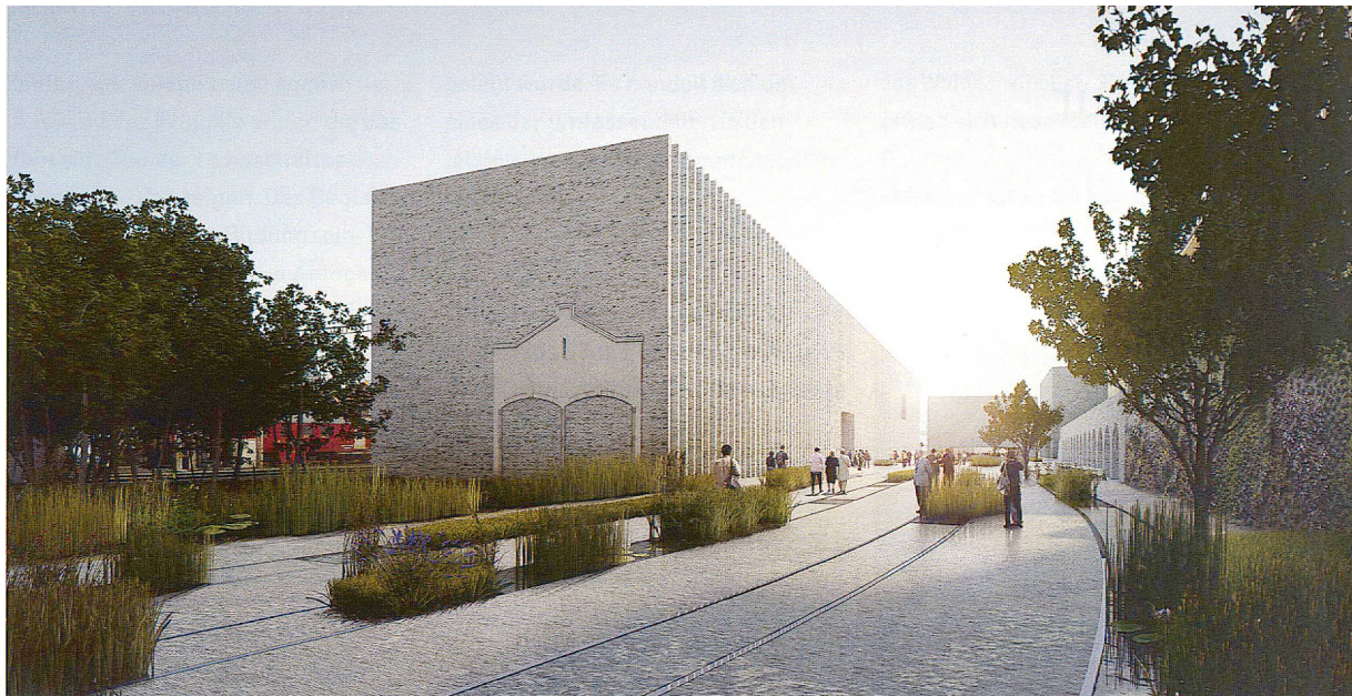
Philipp Schaefer Images (2)

Les lauréats du concours pour le musée cantonal des Beaux-Arts à Lausanne sont les architectes Fabrizio Barozzi et Alberto Veiga, Barcelone, en collaboration avec FHV Architectes, Lausanne, les architectes-paysagistes 4d AG, Berne.