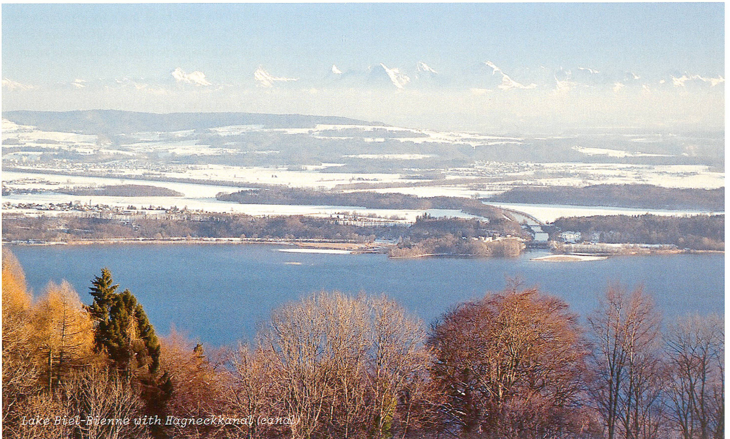
Lake Biel-Bienne with Hagneckkanal (canal)

on and fragmented has reached a point where the central benefits of the landscape, such as recreation/experience, identification, and cultural/natural expression have been partly extinguished. The remaining landscape experiences no longer have anything to do with the picturesque or the Arcadian, but have been reduced to the sober. To appreciate landscapes means recognizing their symbolic and emotional charge. In the process we allow ourselves to be led by traditional ideas of landscape to a greater degree than we realize. Such idealized landscapes are deemed worthy of protection as a result. The fractal urban spaces do not fit in to this notion, they are becoming devoid of image and concept. Precisely because we no longer look into these inter-urban spaces, we lack the possibility of emotional bonding, and ultimately of an aesthetic language. As a result we give these landscapes no chance of a more conscious development. Maybe the urban viewing platforms will open our eyes anew to our urban spaces?