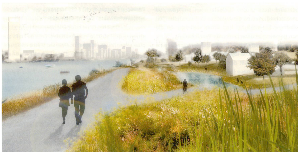
2 Visualisierung der «Village Nature» Palmrain im französischen Huningue. Visualisation du «Village Nature» Palmrain à Huningue, France.

L'espace public constitue l'épine dorsale de cette vision de développement: il est question d'une meilleure accessibilité et de libre circulation sur les bords