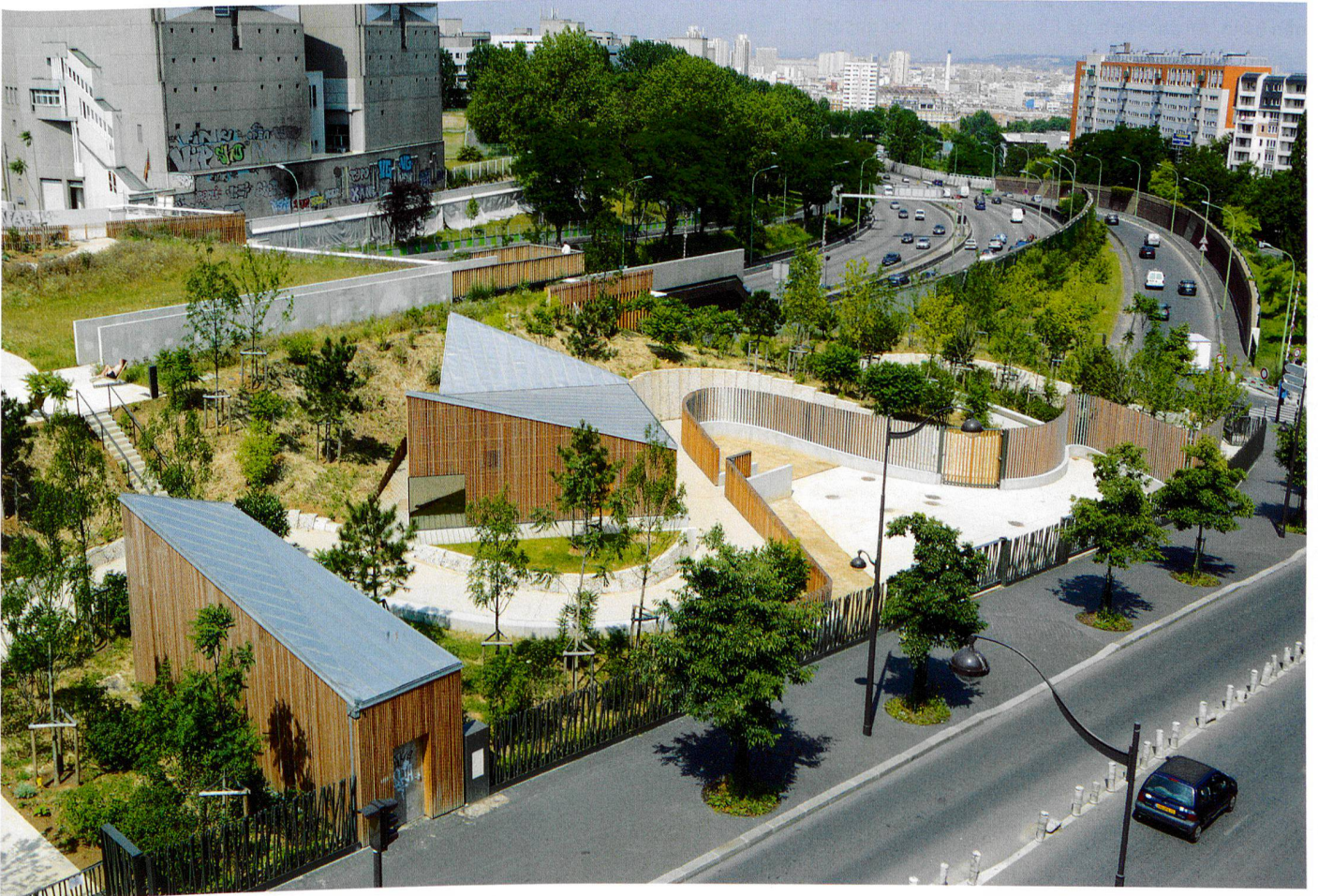
Nicolas Waltefaugle (7)