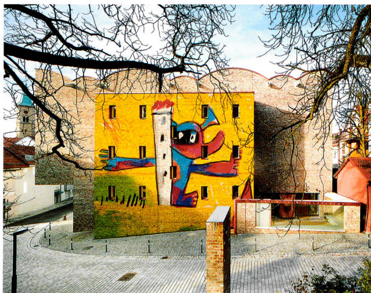
Roland Halber (3)

Gebäudeform und Fassadengestaltung des Ravensburger Kunstmuseums tragen zu seiner Einbindung in das historische Stadtbild bei (rechts). Fassadenprojektion zum Einweihungsfest im März 2013 (links unten).