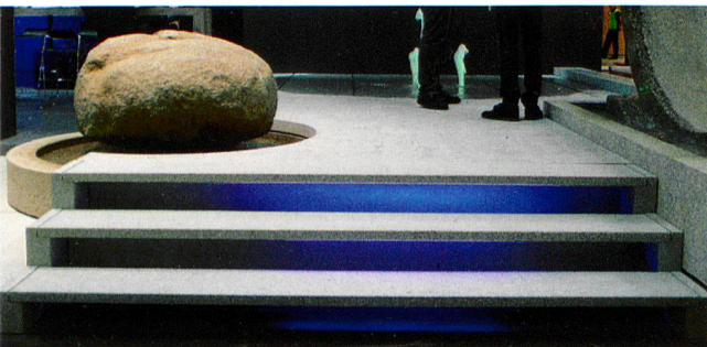
Die 252 cm langen vorgespannten Granitstufen auf der Bau 2013 in München sind nur 4 cm dick.

Weitere Informationen zu über 20 Vorgespannten Granitbrücken und -treppen unter www.kusser.com