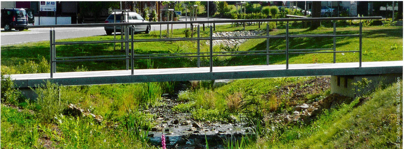
Kattinger + Kattinger Landschaftsarchitekten • L: 7,1 m, d: 15 cm, Tagmersheim, 2011

kurze Produktions- und Montagezeiten aus. Sie werden werkseitig vorgefertigt und entsprechend der zu erwartenden Belastung getestet, so dass sie auf der Baustelle innerhalb weniger Stunden versetzt werden können.