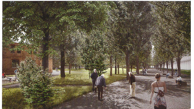
nightnurse images GmbH

Fernbahnhofs Altona weitere Bahnflächen umgenutzt werden. Das Zentrum des Gebiets soll durch einen grossen, zusammenhängenden Park geprägt werden, der sich durch das gesamte Quartier zieht und neue und alte Bereiche miteinander verbindet. Innerhalb des verdichteten städtischen Umfelds erhält der Park eine grosse Bedeutung. Weiträumige Aufenthalts- und Erholungsbereiche, intensiv genutzte Spielflächen sowie die Regenwassernutzung der umliegenden Bebauung sind die Schwerpunkte für seine Gestaltung. Mit diesem freiraumplanerischen Realisierungswettbewerb wurde der erste Bauabschnitt des zukünftigen Stadtteilparks konzipiert. Das Siegerprojekt «Aus dem Ort in die