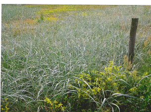
Mark Krieger (5)

sondern auch für den Artenschutz gut. So gibt es inzwischen zum Teil mehr Tier- und Pflanzenarten in den Städten als in den Agrar- und Forstflächen dazwischen. Die gerade so aktuellen vertikalen Gärten jedoch sind in der Pflege sehr aufwendig und dadurch nur für ein Luxussegment in der Architektur geeignet. Dennoch scheinen sie die Kreativität zu beflügeln; die Vertikalbegrünung löste einen wahren Boom der Ideen für Pflanzungen auf, an und in Gebäuden aus, utopische Entwürfe bevölkern das Internet.