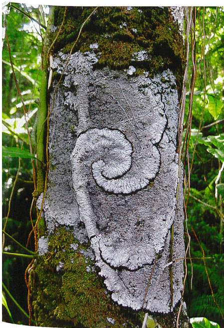
Eric Barbier (3)

Vous reconnaitrez un étudiant en architecture du paysage parce qu'il aime les racines perforant l'asphalte, les friches, les rivages, les fissures moussues, la lisière ou la clairière... Il y a des années pin sylvestre