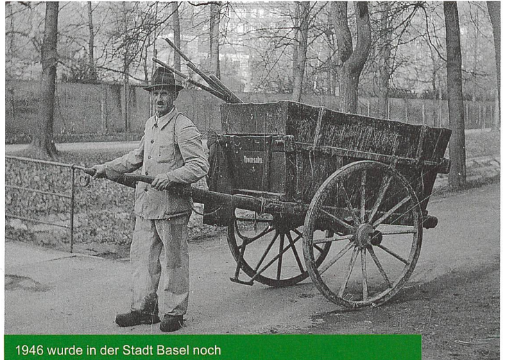
1946 wurde in der Stadt Basel noch ohne Motor und Maschinen gearbeitet.

La «Grosse Schanze» à Berne vers 1964: la végétalisation de la toiture Parkterrasse et du parking représentait un acte pionnier dans le domaine de l'architecture du paysage.