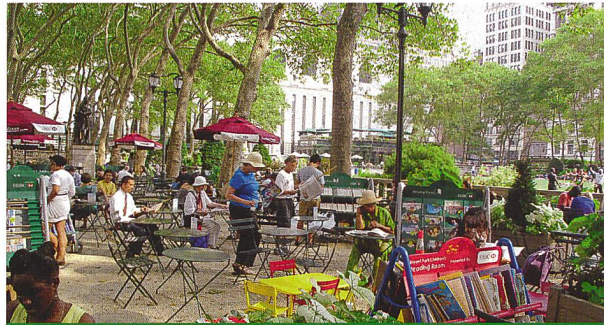
Vielseitige Nutzungen der Parks und Plätze unserer Städte.

Ausser den wichtigen Funktionen für die menschliche Lebensqualität tragen die aktuellen, «vielfältigen Naturen» sicher auf effiziente Weise zur Schaffung sozialer Kontakte bei und geben Freiräumen ein neues Gesicht. Die Lust auf Natur führt in zahlreichen Städten auch zu einer sich ändernden Einstellung in Bezug auf sowohl die Freiraumgestaltung wie auch den Unterhalt der Anlagen.