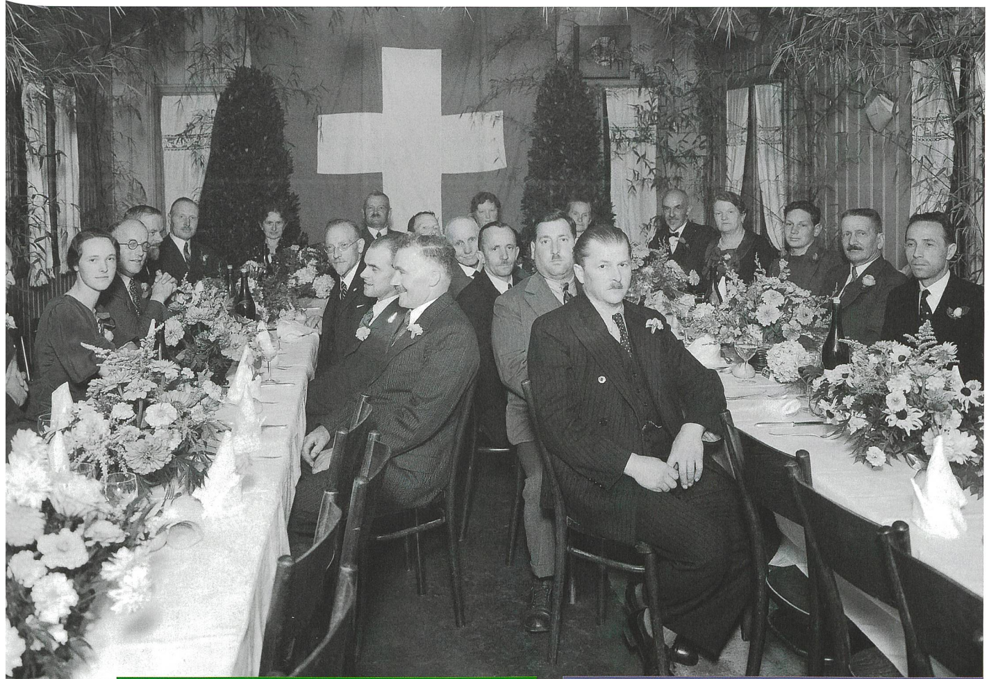
Stadtgärtnertagung vom 12./13. August 1936 in Luzern. Auf die Pflege der Kameradschaft und die Anwesenheit der «verehrten Damen» wurde seit jeher Wert gelegt.