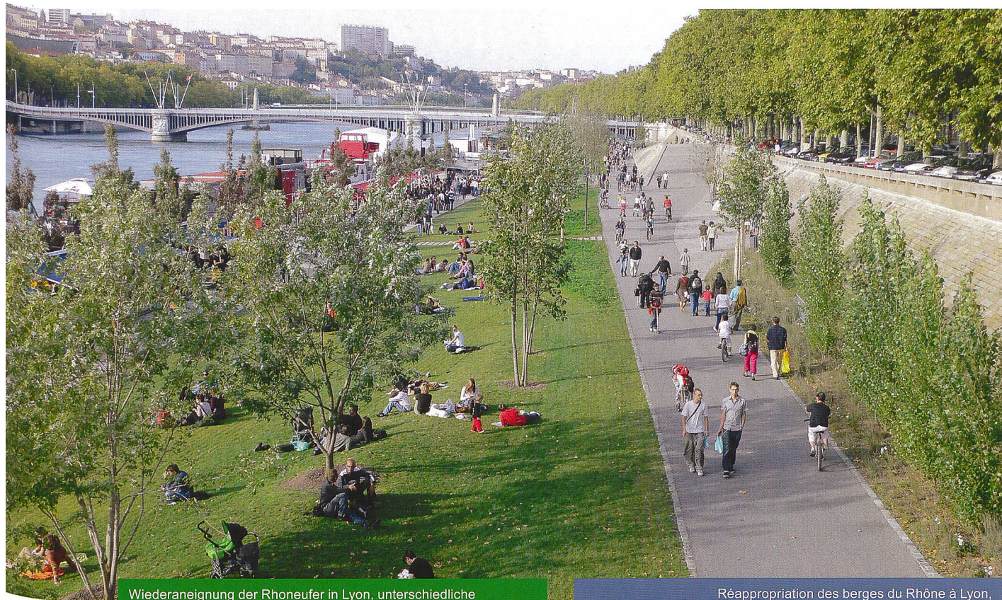
Wiederaneignung der Rhoneufer in Lyon, unterschiedliche Ambiancen und zahlreiche Nutzungsmöglichkeiten.