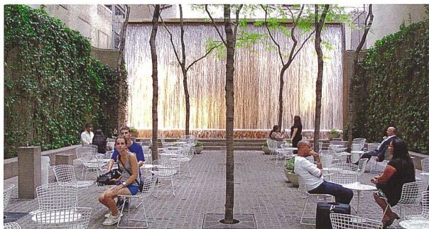
Aufwertung städtischer Brachen, zum Beispiel mit diesem Pocket Garden in New York.

Des usages différents et variés dans les parcs et promenades de nos villes.