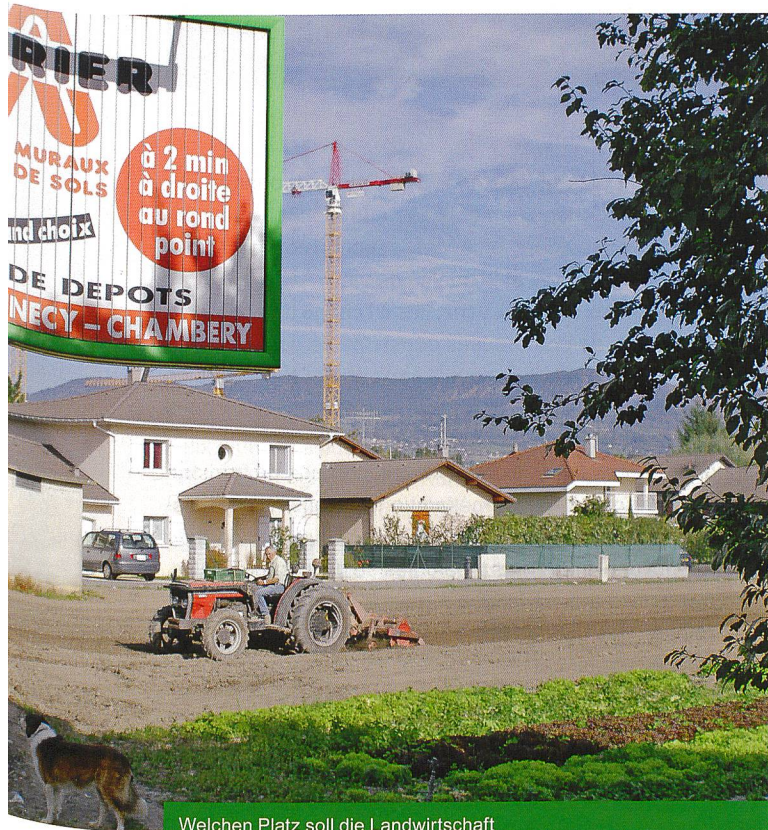
Welchen Platz soll die Landwirtschaft in periurbanen Gebieten einnehmen?