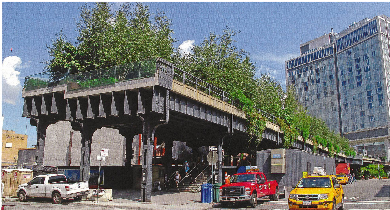
Wandlung der Transportarten und Aufwertung ehemaliger Transporteinrichtungen, «Grünstreifen», Green Line in New York.