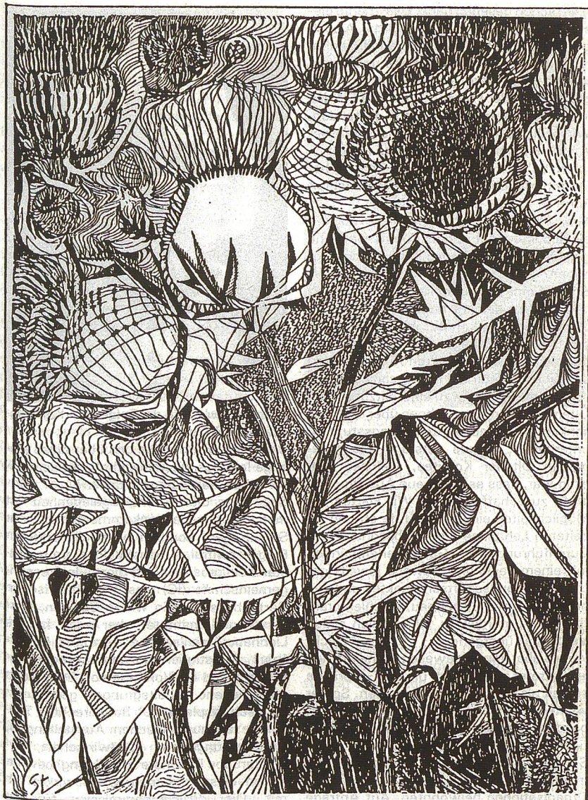
Cirsium eriophorum , Wollköpfige Kratzdistel, Zeichnung von Emil Steiner, in: Der Gartenbau 32 / 1987, S. 1389.