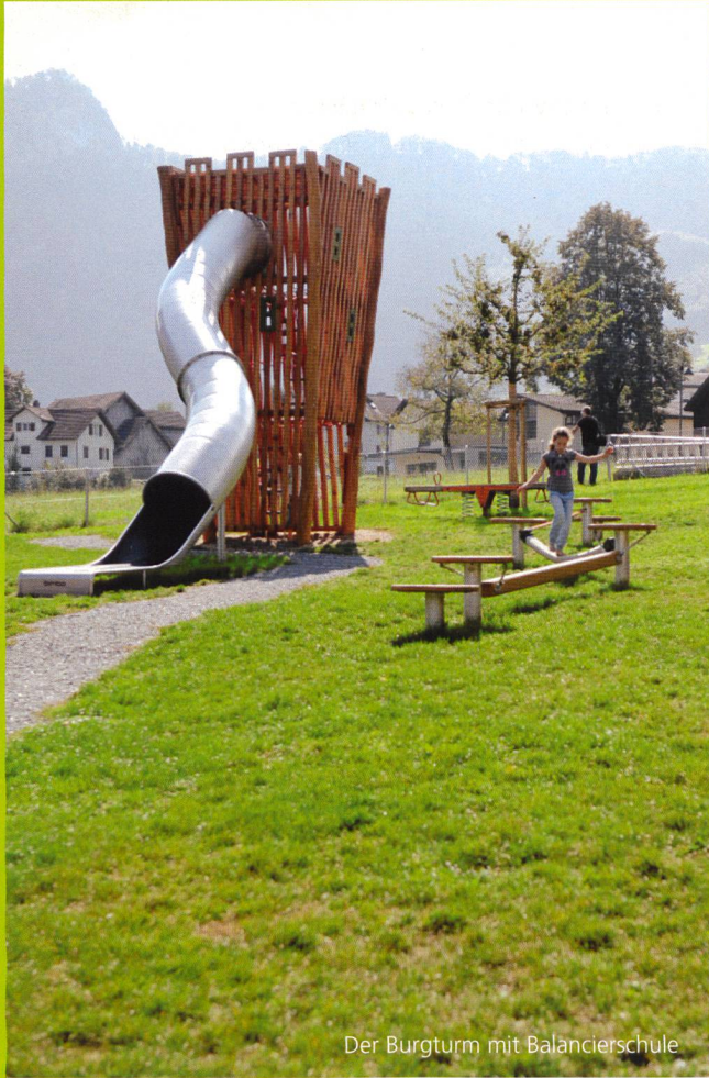
Der Burgturm mit Balancierschule