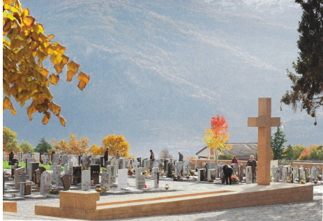
2 linbaphoto (2)