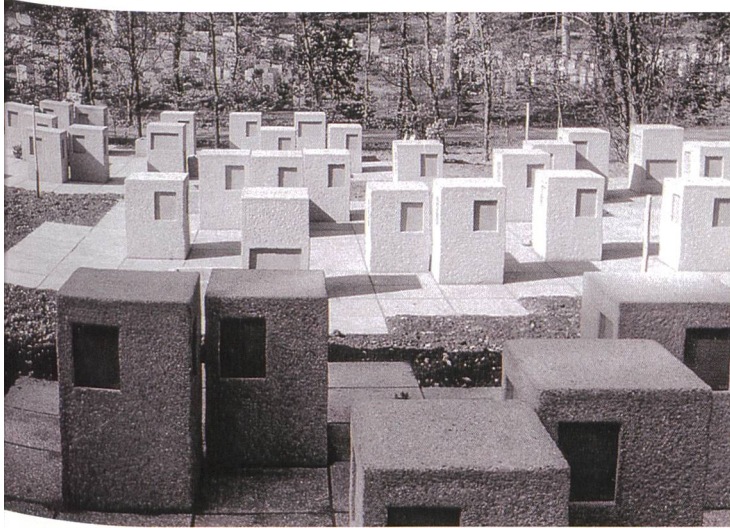
4 Stadtgärtnerei Schaffhausen