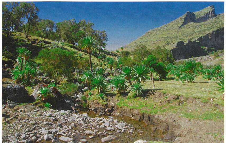
Walter Vetsch (3)