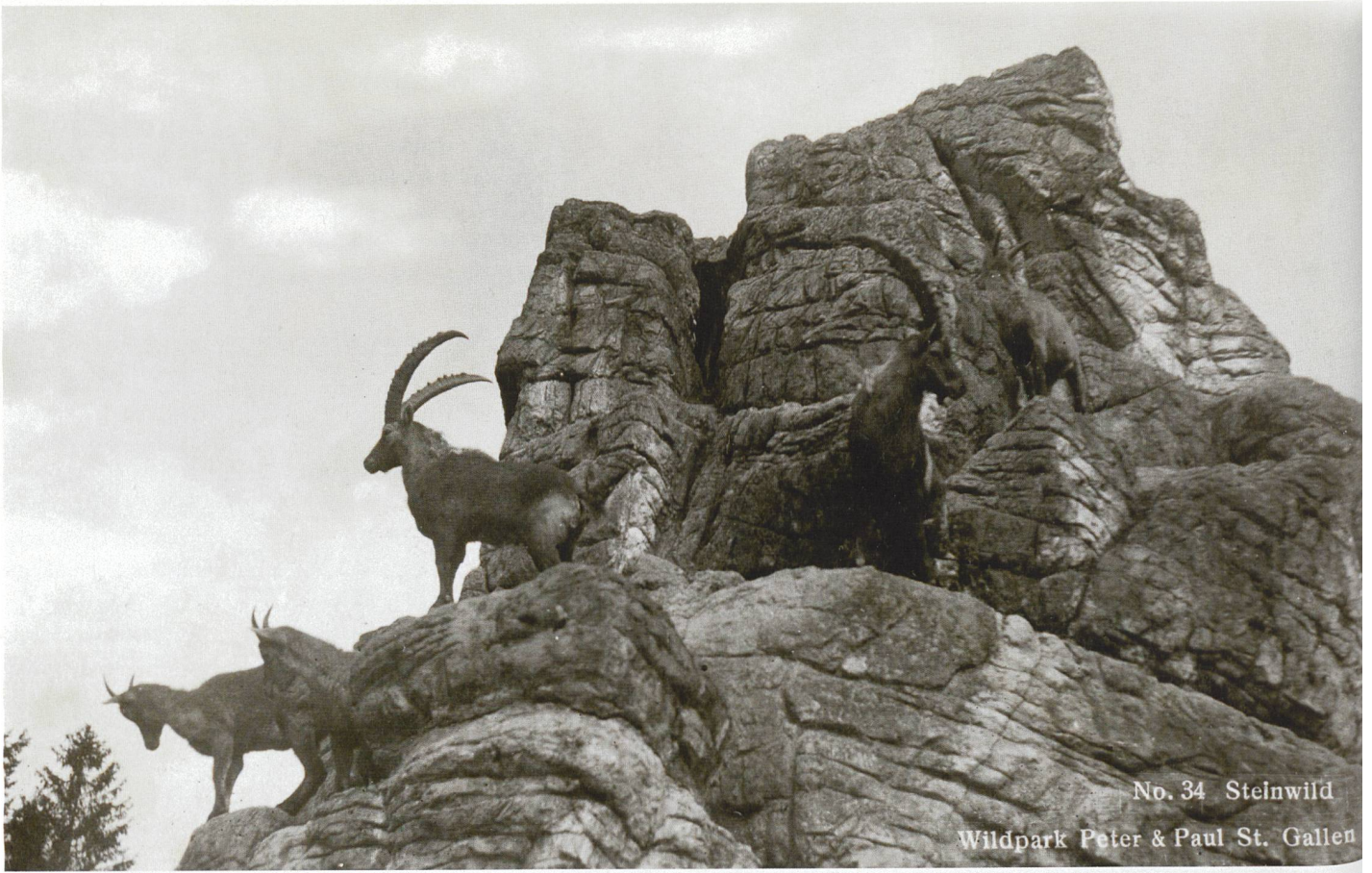
No. 34 Steinwild Wildpark Peter & Paul St. Gallen