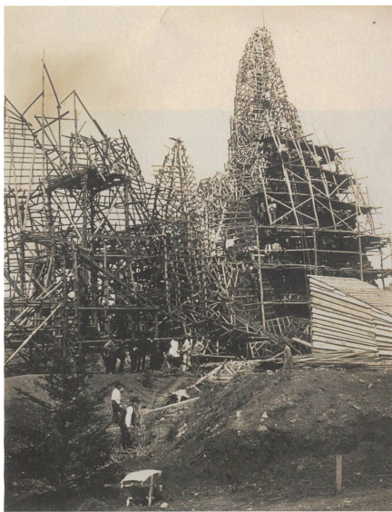
1 Stadterech Zürich VII.105.4.131 2