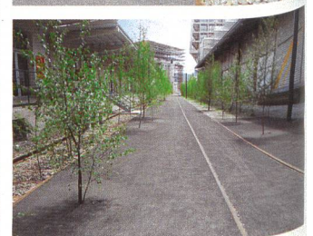
Stéphanie Perrochet (16)