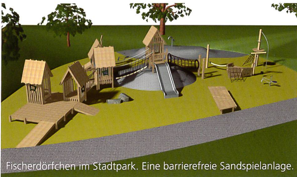
Fischerdörfchen im Stadtpark. Eine barrierefreie Sandspielanlage.