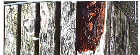
5 Brandlöcher/ Vandalismus. Trous de brûlure/ vandalisme.