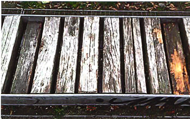
4 Holzbalkenentnahme. Prélèvement de poutres en bois.

Les méthodes de recherche et d'enseignement rattachées traitent les projets paysagers réalisés comme autant de sujets de recherche. Elles font apparaître une possibilité de relier le potentiel synergétique de l'enseignement, de la recherche et de la pratique professionnelle.