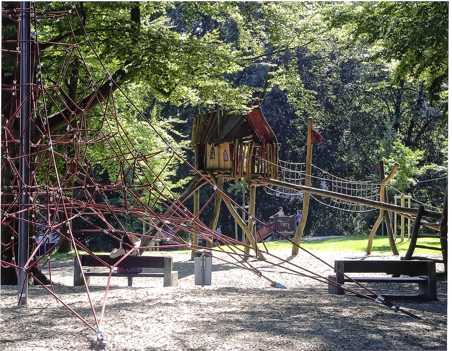
Thom Roelly 2016

Spielplatz Buechwaldpark, St. Gallen. Der Spielplatz, 1955 erbaut, wird laufend an aktuelle Bedürfnisse angepasst. Erweiterungen: Gartenbauamt St. Gallen.