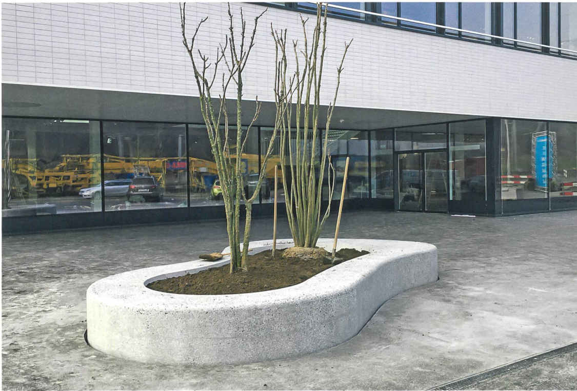
3 Vorplatz SABAG, Rothenburg. Dégagement SABAG, Rothenburg.