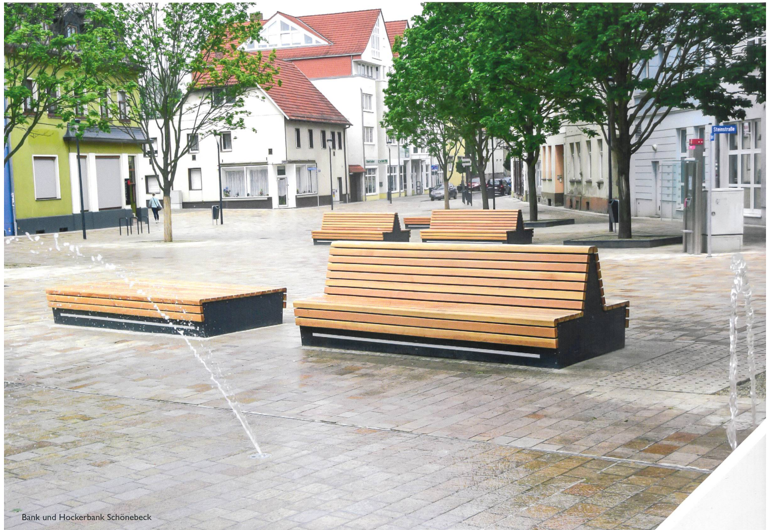
Bank und Hockerbank Schönebeck

Intelligente Möbelsysteme von Elancia: stabil, flexibel und nutzerfreundlich