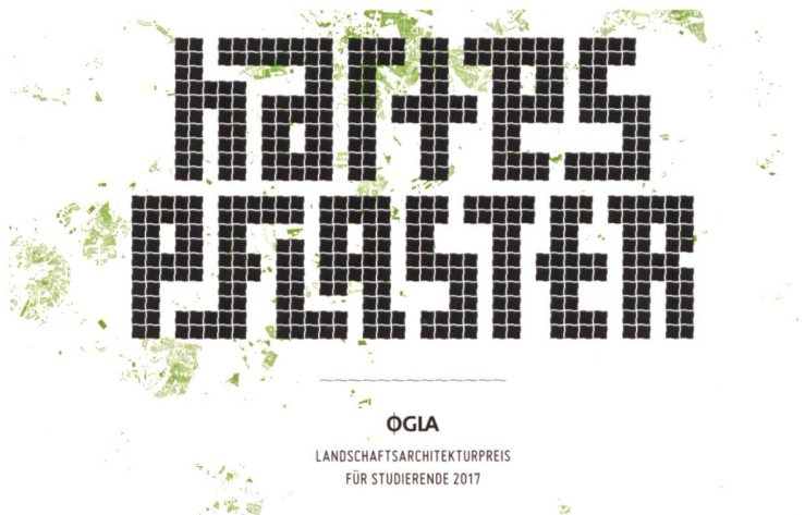
Adrià Goula Photo

Eine Zusammenarbeit mit Studierenden anderer Fachrichtungen ist