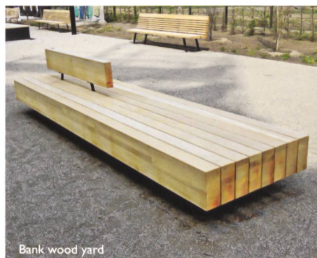
Bank wood yard

Bei der Gestaltung öffentlicher Räume und Parkanlagen setzen Sie mit ELANCIA immer auf den richtigen Partner. Denn mit uns an Ihrer Seite können Sie sich auf größtes Know-how von der Planung bis hin zur Realisierung verlassen. Schnell, präzise und aus einer Hand!