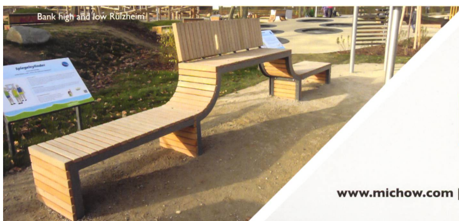
Bank high and low Rülzheim

Bei der Gestaltung öffentlicher Räume und Parkanlagen setzen Sie mit ELANCIA immer auf den richtigen Partner. Denn mit uns an Ihrer Seite können Sie sich auf größtes Know-how von der Planung bis hin zur Realisierung verlassen. Schnell, präzise und aus einer Hand!