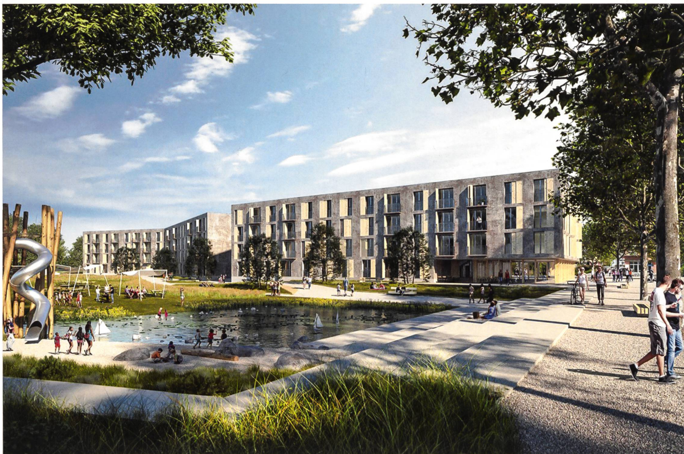
Wir sind Stadtgarten

Der Stadtteilpark Holligen Nord zeichnet sich durch eine starke Durchgrünung und eine vielseitig nutzbare Fläche aus.