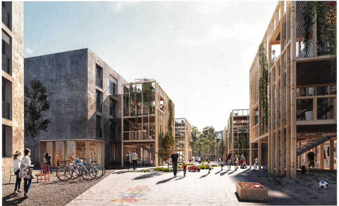
Wir sind Stadtgarten

Die Wohnüberbauung Mutachstrasse bietet 110 preisgünstige Wohnungen, umgesetzt in einfacher und robuster Architektur.