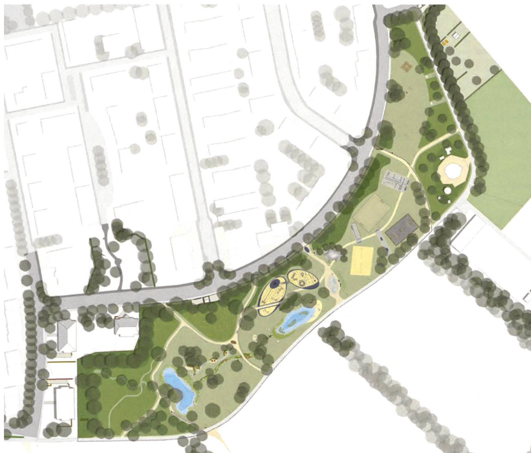
Förder Landschaftsarchitekten GmbH