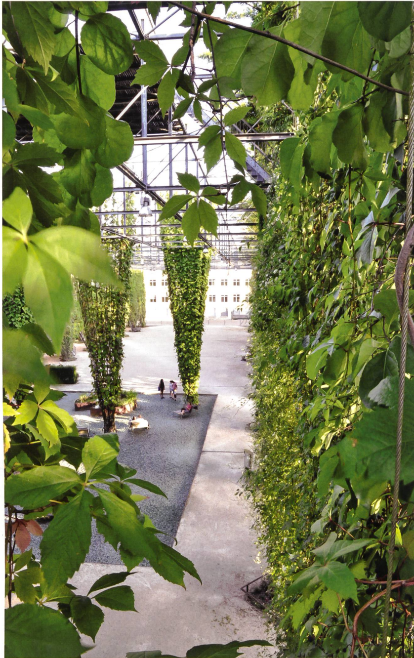
MFO Park, Zürich Oerlikon, Planergemeinschaft Burckhardt + Partner AG (Architektur) / raderschallpartner ag (Landschaftsarchitektur).