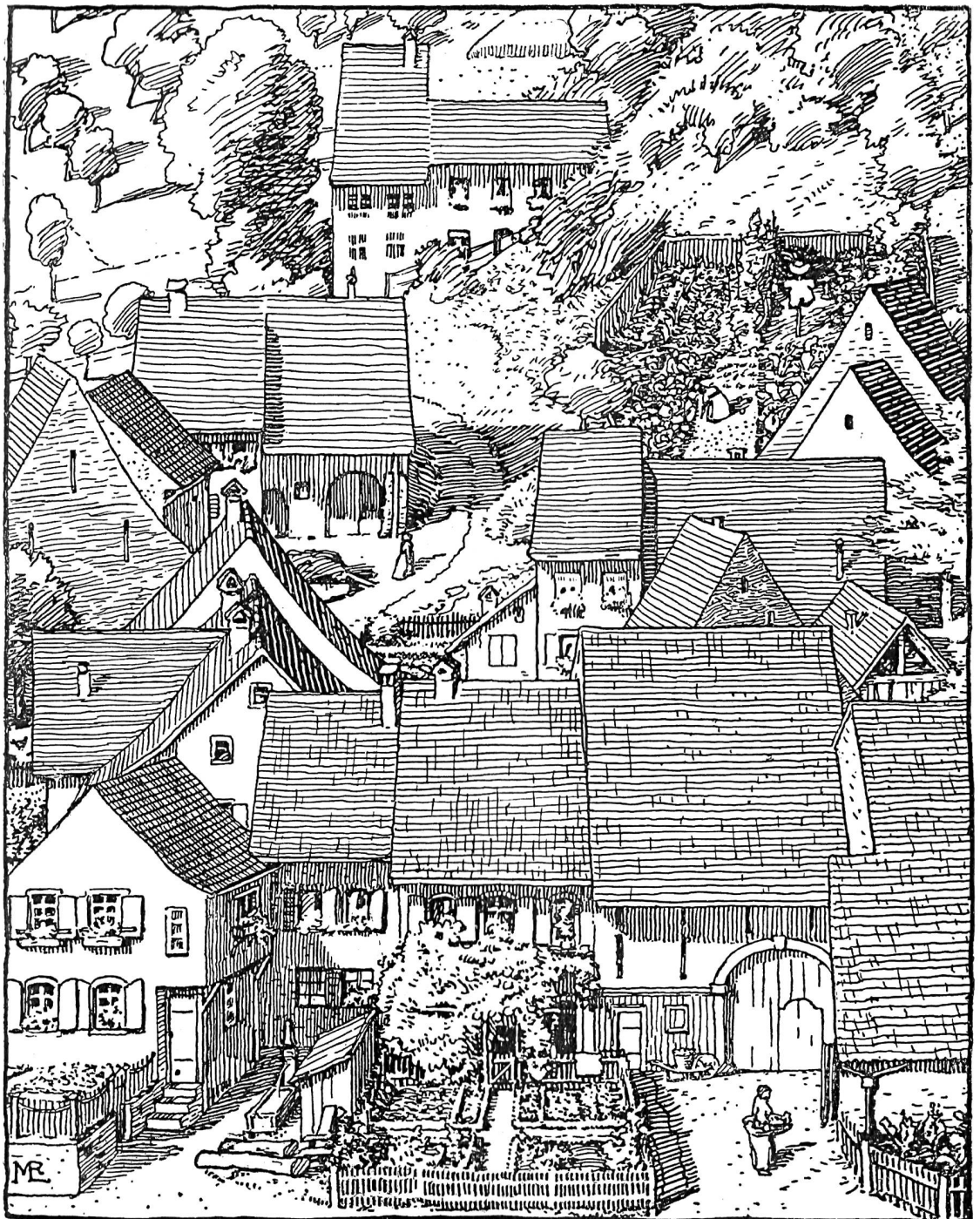
1 Dorfidylle des 19. Jahrhunderts – im Vordergrund ein Bauerngarten in klassischer Vierteilung. Ormalingen, Basel-Landschaft. 1 Idylle villageoise du 19 e siècle. Au premier plan, un jardin agricole traditionnel en quatre parties. Ormalingen, Bâle-Campagne. 1