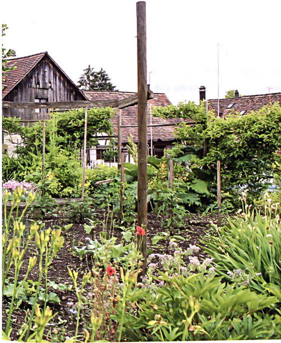
SMS Landschaftsarchitektur (2)