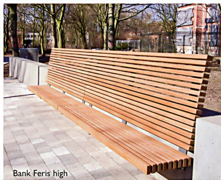
Bank Feris high

Bei der Gestaltung öffentlicher Räume und Parkanlagen setzen Sie mit ELANCIA immer auf den richtigen Partner. Denn mit uns an Ihrer Seite können Sie sich auf größtes Know-how von der Planung bis hin zur Realisierung verlassen. Schnell, präzise und aus einer Hand!