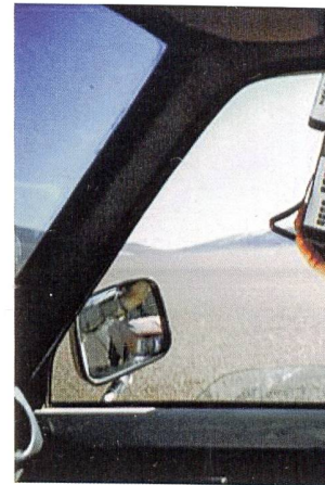
Einsatz eines GPS-Empfängers bei der Geländearbeit. Hochaden, 1993.