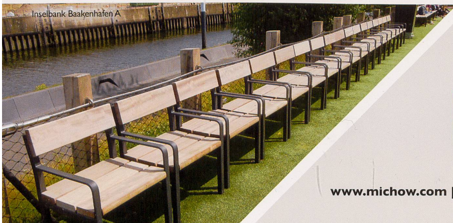
Inselbank Baakenhafen A

Bei der Gestaltung öffentlicher Räume und Parkanlagen setzen Sie mit ELANCIA immer auf den richtigen Partner. Denn mit uns an Ihrer Seite können Sie sich auf größtes Know-how von der Planung bis hin zur Realisierung verlassen. Schnell, präzise und aus einer Hand!