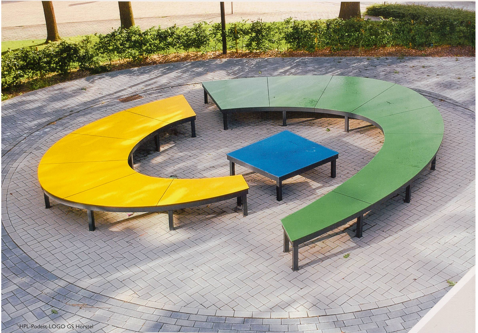
HPL-Podest-LOGO GS Hörstel

Intelligentes Stadtmobiliar: innovativ, kommunikativ, inspirierend