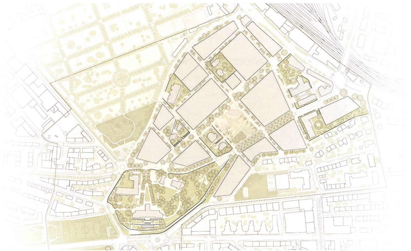
DUO Architectes paysagistes (2)

«Rahmenplan Freiraum», Bern, Inselareal. Mandat d'études parallèles remportés en Mars 2019.