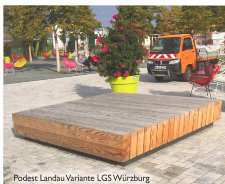
Podest Landau Variante LGS Würzburg

Bei der Gestaltung öffentlicher Räume und Parkanlagen setzen Sie mit ELANCIA immer auf den richtigen Partner. Denn mit uns an Ihrer Seite können Sie sich auf größtes Know-how von der Planung bis hin zur Realisierung verlassen. Schnell, präzise und aus einer Hand!