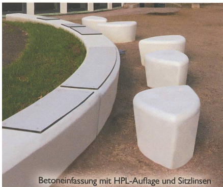
Betoneinfassung mit HPL-Auflage und Sitzlinsen