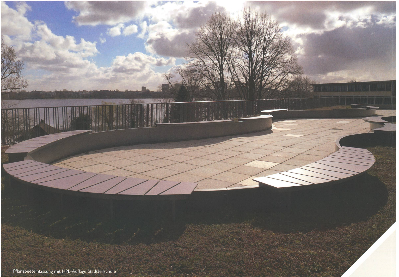
Pflanzbeeteinfassung mit HPL-Auflage Stadteilschule

Intelligentes Stadtmobiliar: innovativ, kommunikativ, inspirierend