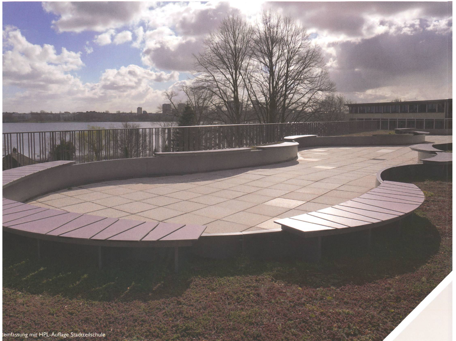
Umgestaltung mit HPL-Auflage Stadtreischule

Intelligentes Stadtmobiliar: innovativ, kommunikativ, inspirierend