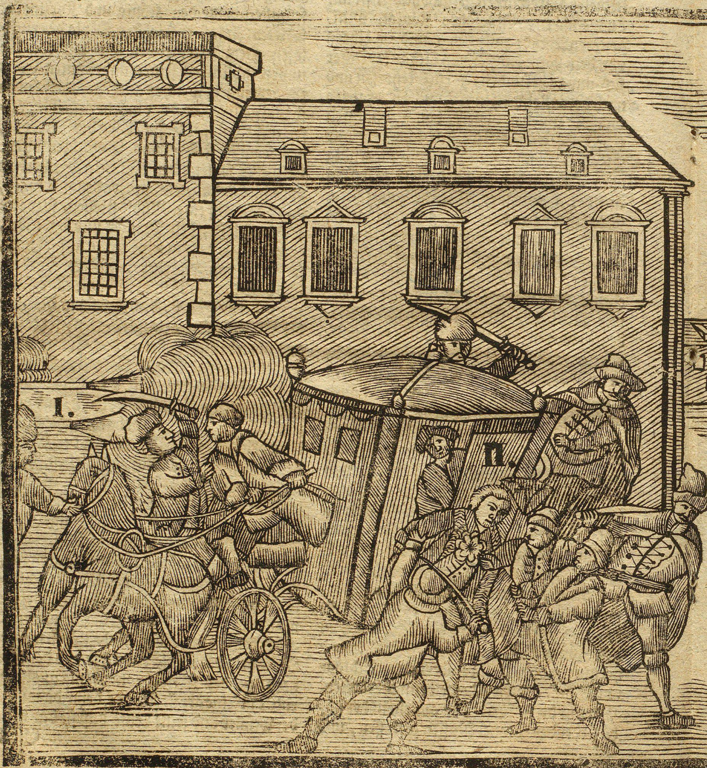
I. Die Abführung auf den König. II. Die gewaltthätige Herausreißung des Königs a