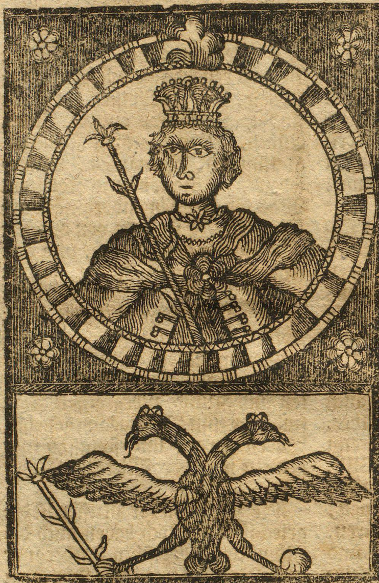
Abbildung der Russischen Kayserin Catharina II.

Ein Engländer der lange Zeit seinen Aufenthalt in Petersburg gehabt, beschreibt die Person und Character der heut zu Tag glorreichen regierenden Russischen Kayserin mit folgenden Worten.