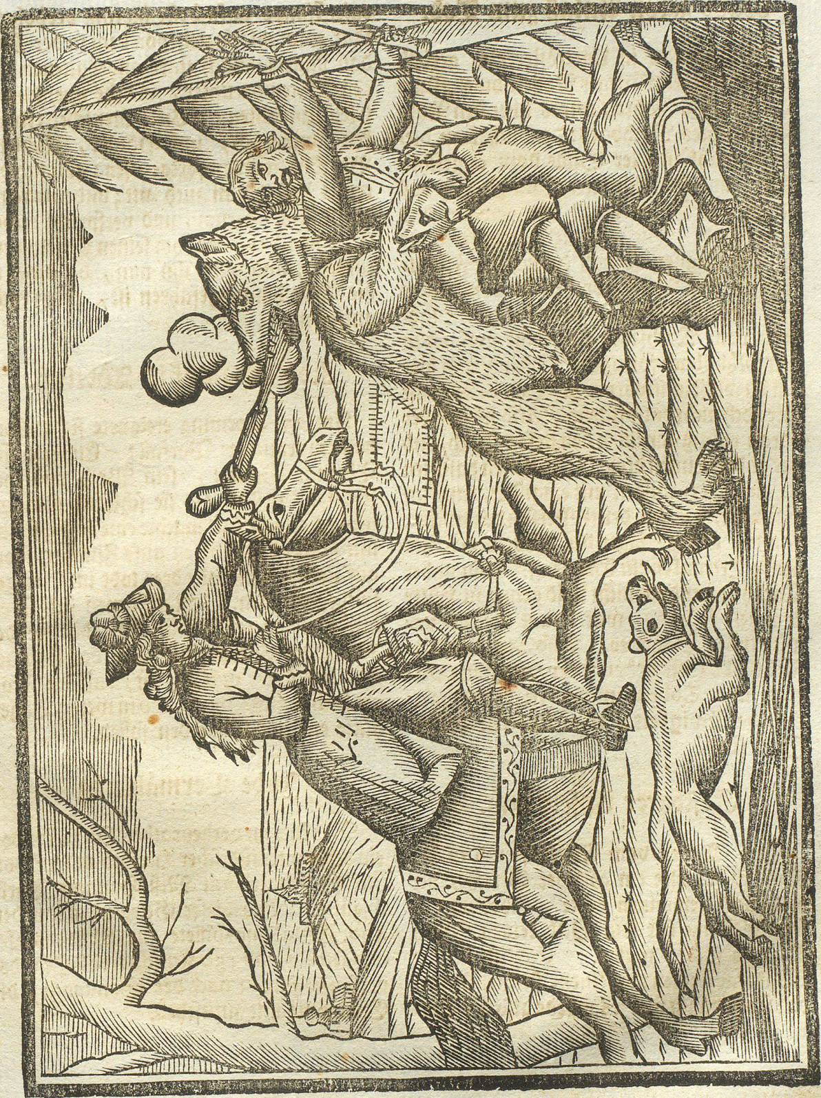
Vorstellung des von einem Bären angegriffene Bediente.