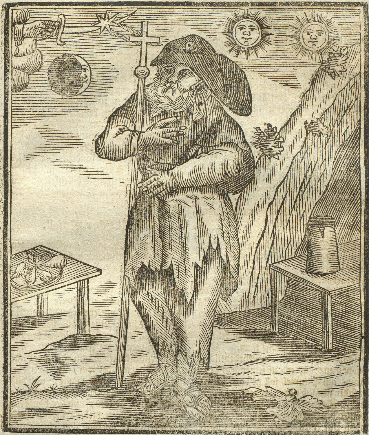
Vorstellung eines 120 jährigen alten Weisfagers.