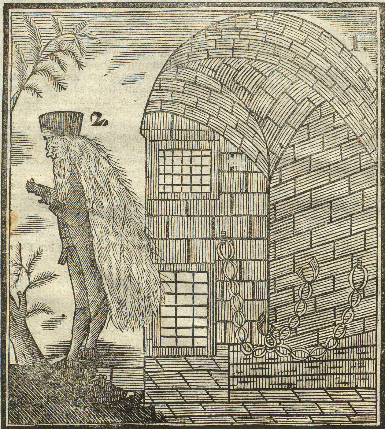
1. Die innere Gestalt des Gefängniß.

Vorstellung des in der vorigen Seite beschriebenen Graf von Onge, der 40. Jahre in der Bastille gefangen gewesen, in welcher Zeit die Haare bis nahe zur Erden gewachsen