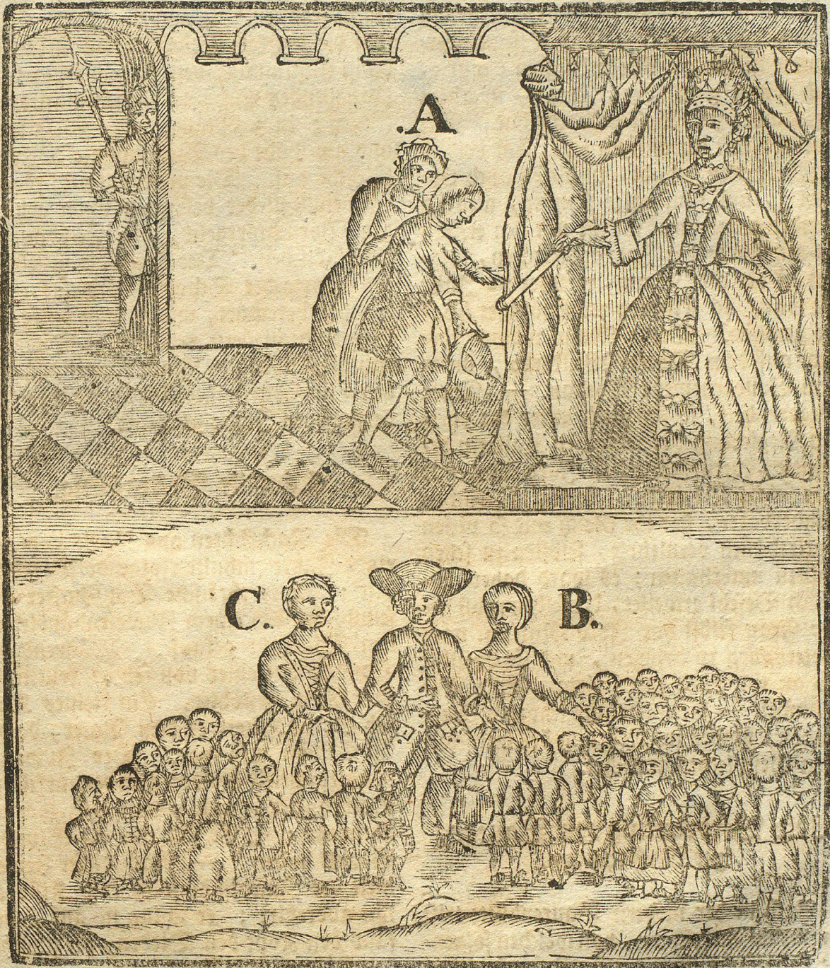
A. Der Bauer nebst seiner Frau, wie sie die Gnade hatten, mit Ihre Maj. der russischen Kaiserin zu sprechen. B. Des Bauers erste Frau, mit ihren erzeugten 33 Kindern. C. Desser zweyte jetztlebende Frau, nebst ihren erzeugten 13 Kindern.