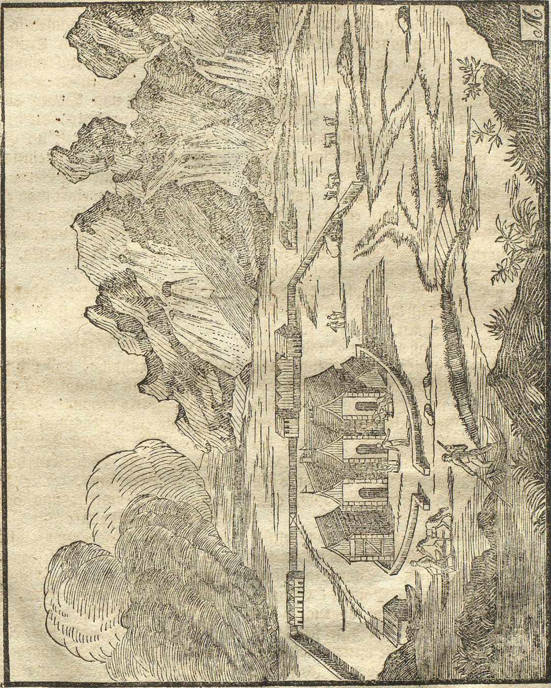
Abbildung eines isländischen Bauernhofes, nebst einer kurzen Beschreibung von Island.