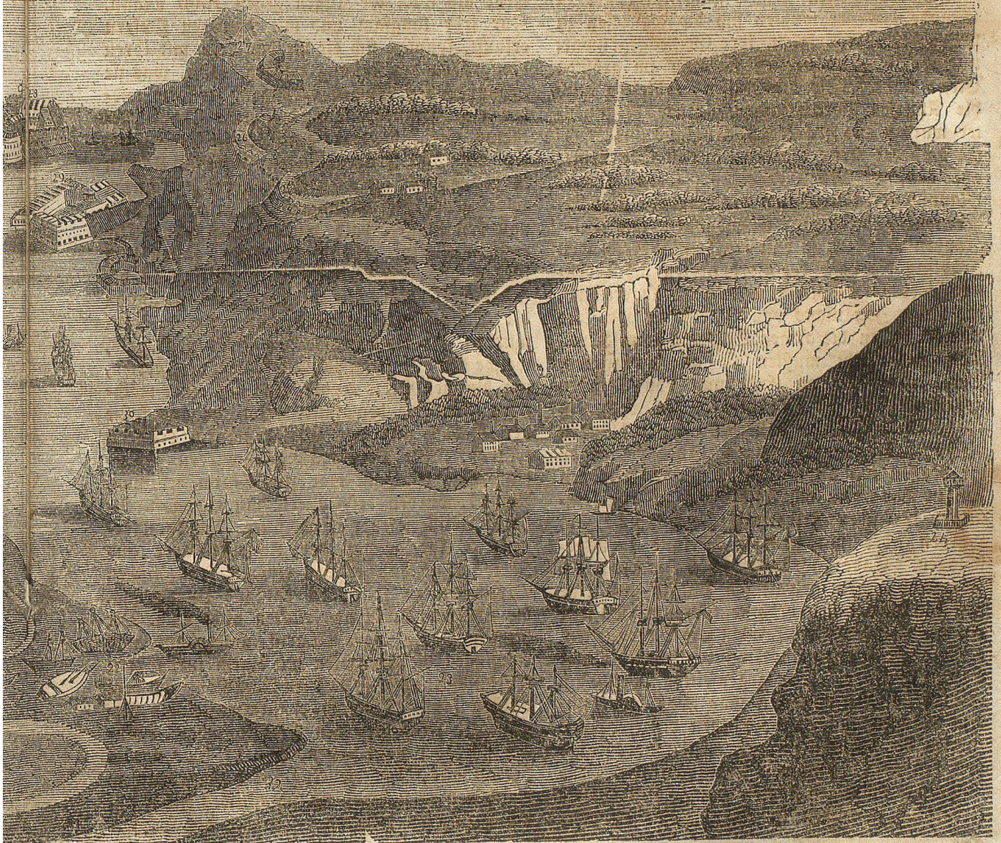
id seine Befestigungen.