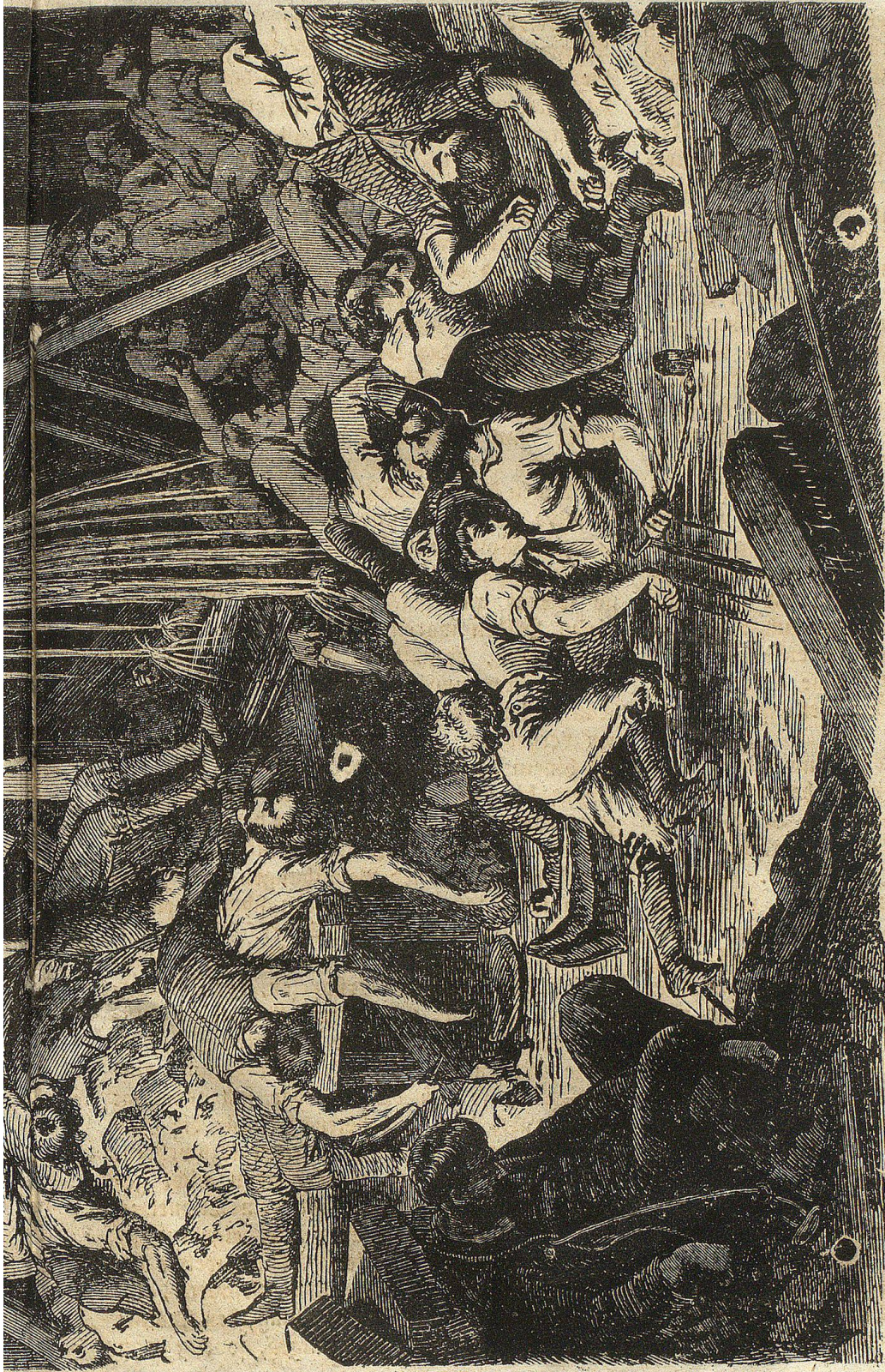
Auffindung der ersten 31 Todten im Hauenstein = Tunnel.