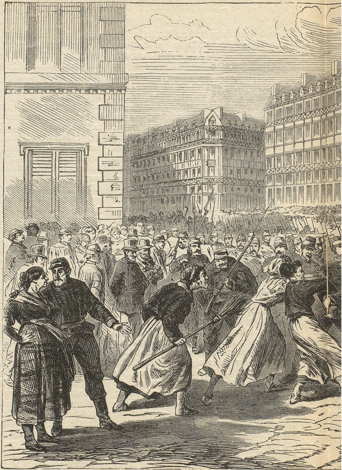
Transport gefangener Gensb'

Die weitaus größte Zahl der Revolutionäre lieferten aber die Hunderttausende von Arbeitern, die während der Belagerung von Paris durch die Deutschen 6 Monate im Solde der Regierung gestanden, sich der Arbeit entwöhnt hatten, und denen dieses Bummelleben so sehr zur Gewohnheit geworden war, daß sie sich nach Beendigung des Krie-