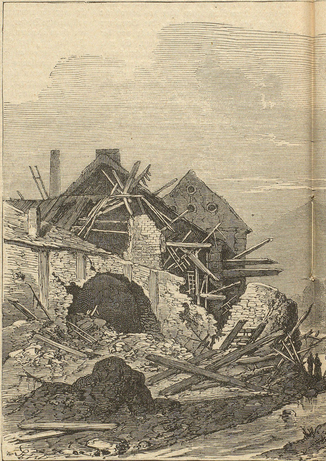
Zerstörung in Romo

Das Hochwasser brachte auch merkwürdige Terrainveränderungen hervor. So fand im Voitlesthal eine Bergabrutschung in großer Ausdehnung statt. Eine ziemlich breite Schlucht ward nämlich durch herabgestürzte Erdmassen verstopft, wodurch das Wasser einen kleinen See bildete, der anfänglich 60 Klafter breit, 120 lang und 4 tief war, sich dann aber einen Durchlaß bahnte, so daß die Gefahr der Ueberschwemmung für die nahe Ortschaft