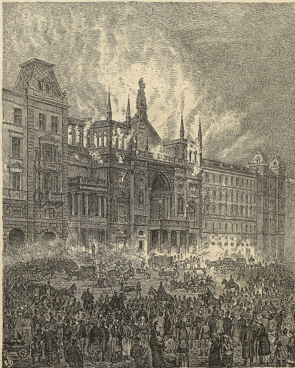
Der Brand des Ringtheaters in Wien.

zustand des russischen Pöbels? Gut, gehen wir in den jüdischen Spital zu Odessa, wo die Opfer der scheußlichen Judenverfolgung in Südrußland — Balta — Zeugniß geben. Ein Wiener Arzt,